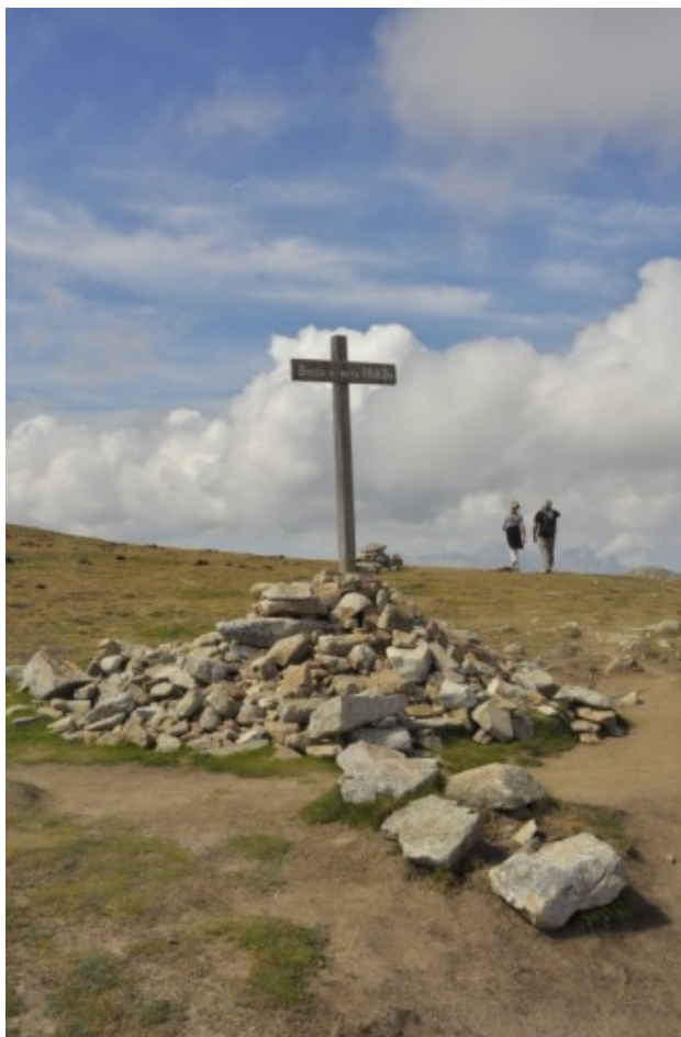
La « Bocca a reta »

Nous allons passer de l'altitude du lac (1740 m) à une altitude de 1857m avant le Col San petru.