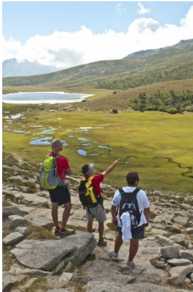
Le lac et les pozzini vus depuis la crête.