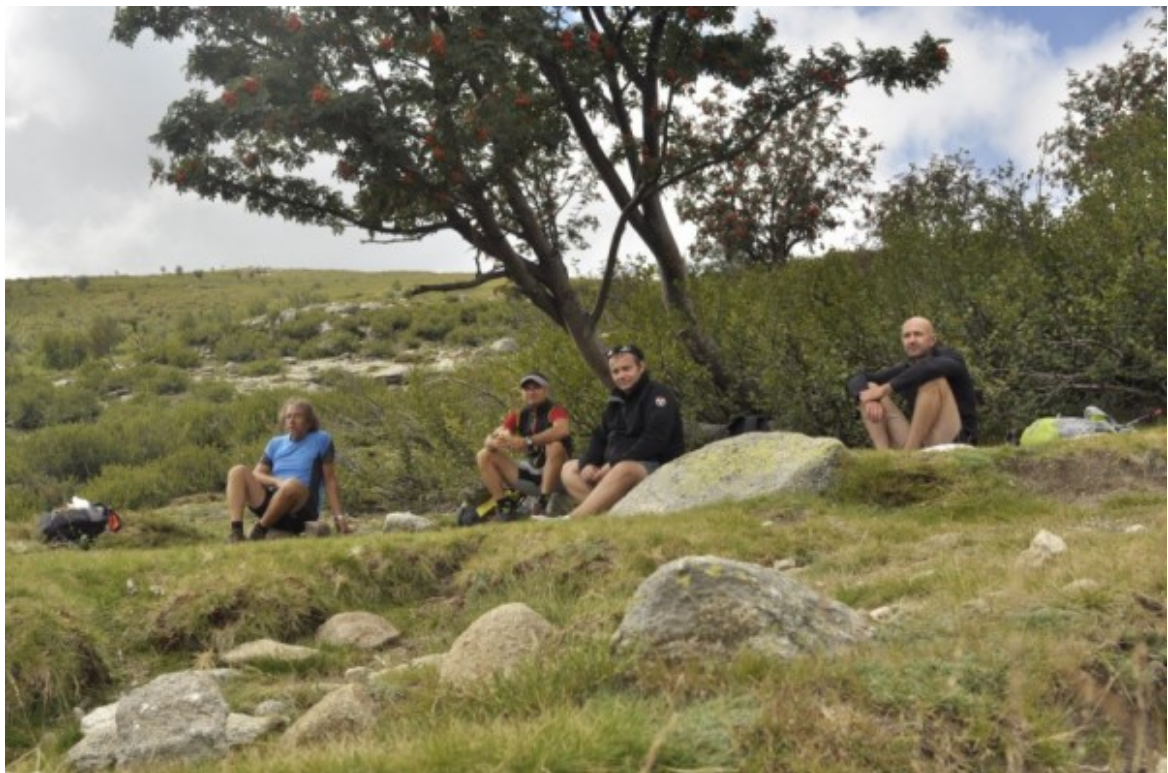
La pause casse-croûte.