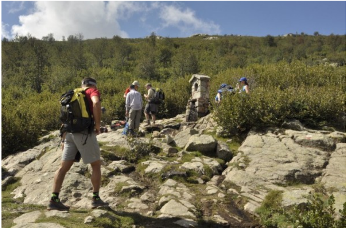
Le point d'eau avant la montée.