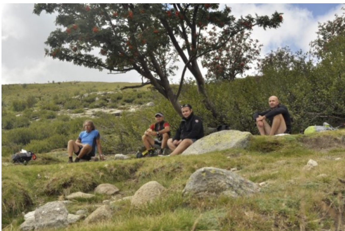
La pause casse-croûte.