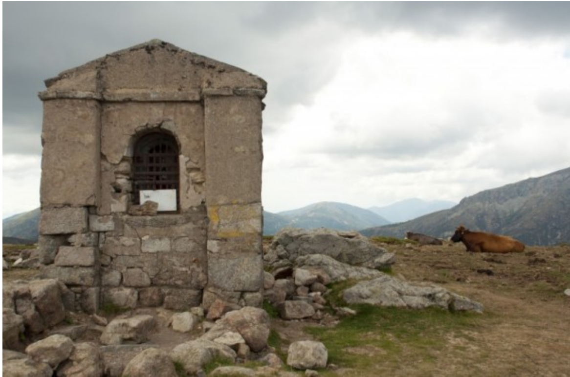
Dernier Col avant de redescendre vers la station